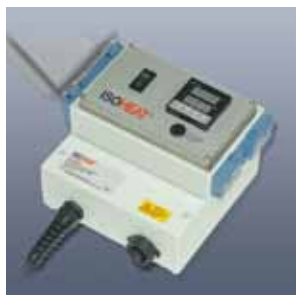
Elektronischer Temperaturregler Serie MiL-RD1000