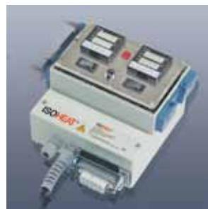
Elektr. Regler-Begrenzerkombination MiL-RD3000