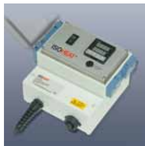
Elektronischer Laborregler Serie MiL-RD1000