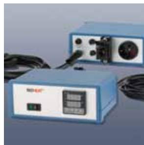
Elektronischer Laborregler Serie MiL-RX1000