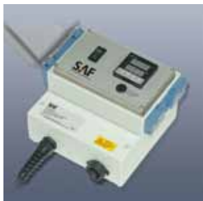
Elektronischer Temperaturregler Serie MiL-RD1000