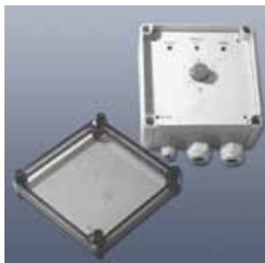
Elektronischer Temperaturregler MiL-EC200

Zur Temperaturregelung empfehlen wir unser Programm an elektronischen Steuer- und Temperaturregelgeräten sowie die entsprechenden Temperaturfühler: