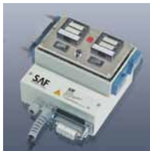
Elektr. Regler-Begrenzerkombination MiL-RD3000